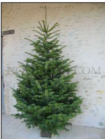
La démarche est simple !

Les bénéfices de cette vente permettront le financement de projets scolaires pour nos enfants (table de ping pong, bancs, paniers de baskets, cabanes en bois...).