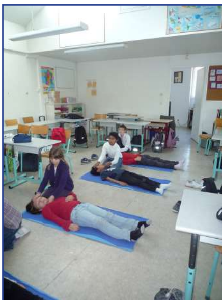
Séance Premiers secours en CM2

Dans ce même livret, figure le «B2i», ce qui signifie : «brevet informatique et internet». L'école s'est équipée l'an passé de 15 Macintosh portables afin de préparer les élèves à valider le «B2i». Tout au long de l'année les élèves du cycle III vont participer à des ateliers informatiques pour acquérir les compétences requises pour valider le «B2i» en fin de CM2.